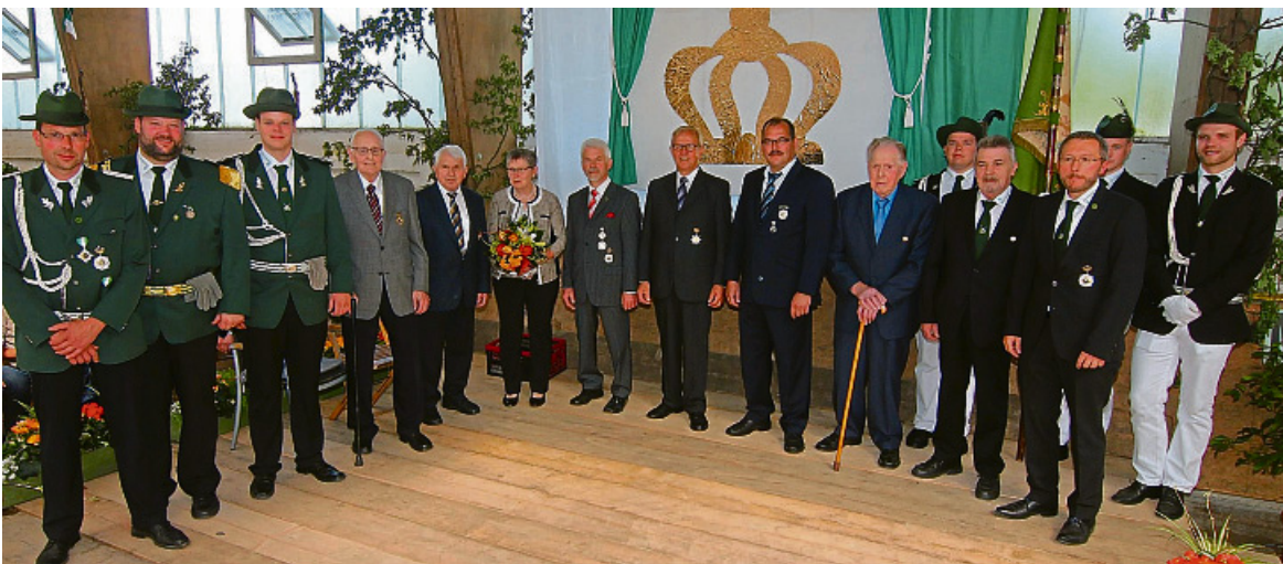
Nach dem Schützengottesdienst in der Reithalle am Gasthaus Quante wurden traditionell die Jubelkönigspaare der Jahre 1992, 1977 und 1967 sowie langjährige Mitglieder des Schützenvereins „Alt- und Neuahlen“ geehrt.